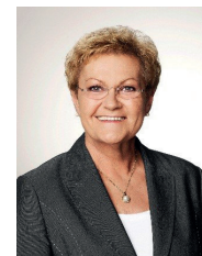
Monika Bachmann Integrationsbeauftragte der saarländischen Landesregierung Ministerin für Soziales, Gesundheit, Frauen und Familie

Im Saarland haben in jüngster Zeit viele Flüchtlinge Schutz vor Verfolgung und Krieg gefunden. Es ist uns gemeinsam gelungen diesen Menschen eine Perspektive und damit neue Lebenschancen zu eröffnen. Der beispiellose Einsatz und die gelebte Solidarität der saarländischen Bevölkerung haben maßgeblich dazu beigetragen. Der Spracherwerb, die Bildung, die Ausbildung und die Beschäftigung sind weitere wichtige Schritte hin zur gesellschaftlichen Integration und werden uns in den kommenden Jahren vor weitere große Herausforderungen stellen. Die IMMIGRA gibt nachhaltige Impulse im Kontext der beruflichen und gesellschaftlichen Integration und unterstützt damit die Flüchtlings- und Integrationspolitik der Landesregierung. Ich danke deshalb der Kreisstadt Merzig und dem IQ-Netzwerk dafür, dass sie zusammen mit vielen weiteren Akteuren auch in diesem Jahr diese tolle Veranstaltung ermöglichen.